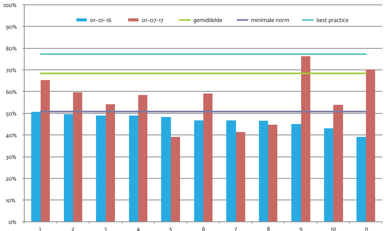
Figuur 2 Ontwikkeling van praktijken met het percentage patiënten met verhoogd vasculair risico < 80 jaar en RR ≤ 140 mmHg onder de minimale norm. De paarse lijn geeft de minimale norm aan.

2711. Hiervan komen gemiddeld 229 patiënten (8,4%) met verhoogd vasculair risico in aanmerking voor deelname aan het zorgprogramma. Bij 49 patiënten spelen factoren waardoor zij niet deelnemen aan het programma zoals gebrek aan motivatie, multimorbiditeit, terminale aandoeningen, (zeer) hoge leeftijd of controle in de tweede lijn. Uiteindelijk nemen 180 patiënten per praktijk (6,6%) daadwerkelijk deel aan het zorgprogramma.